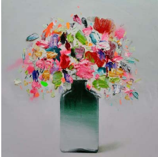
Flores en florero verde, Fran Mora